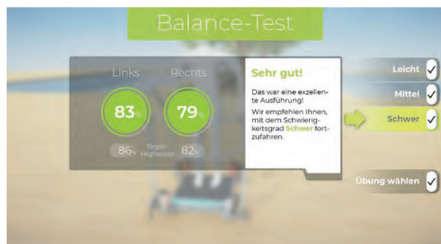
Das individuelle Leistungsniveau wird zu Anfang und während des Trainings ausgegeben