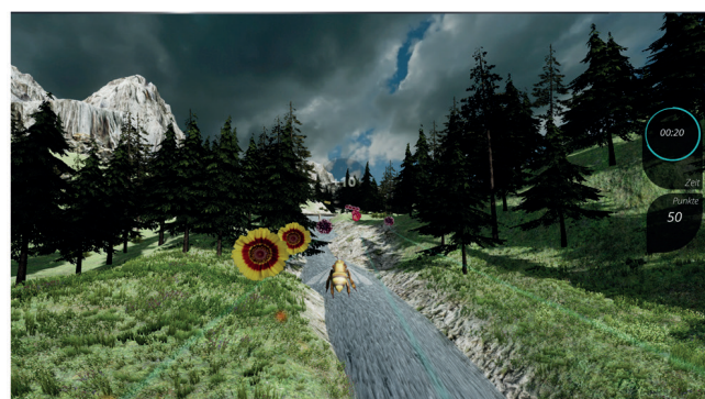
Balancetraining durch Gewichtverlagerung