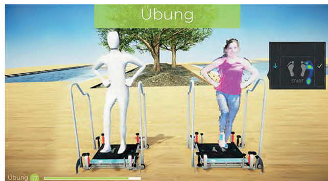
Der virtuelle Trainer macht die Übungen vor und der Übenende erhält ein direktes visuelles Feedback.