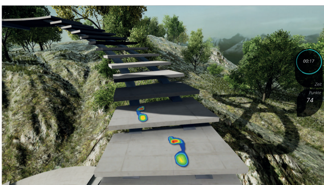
Schnelligkeitstraining in virtueller Umgebung