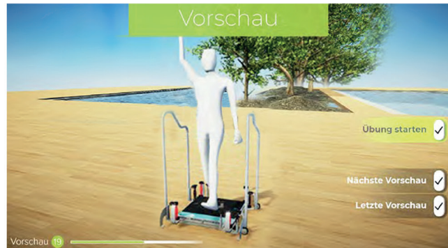
Die selbsterklärende Übungsvorschau durch eine 3D-Anleitung mit Avatar im Vorführmodus